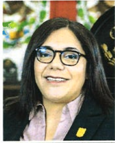
DIP. LUCERO DEOSDADY MARTÍNEZ LÓPEZ PRESIDENTA